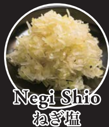
Negi Shio ねぎ塩